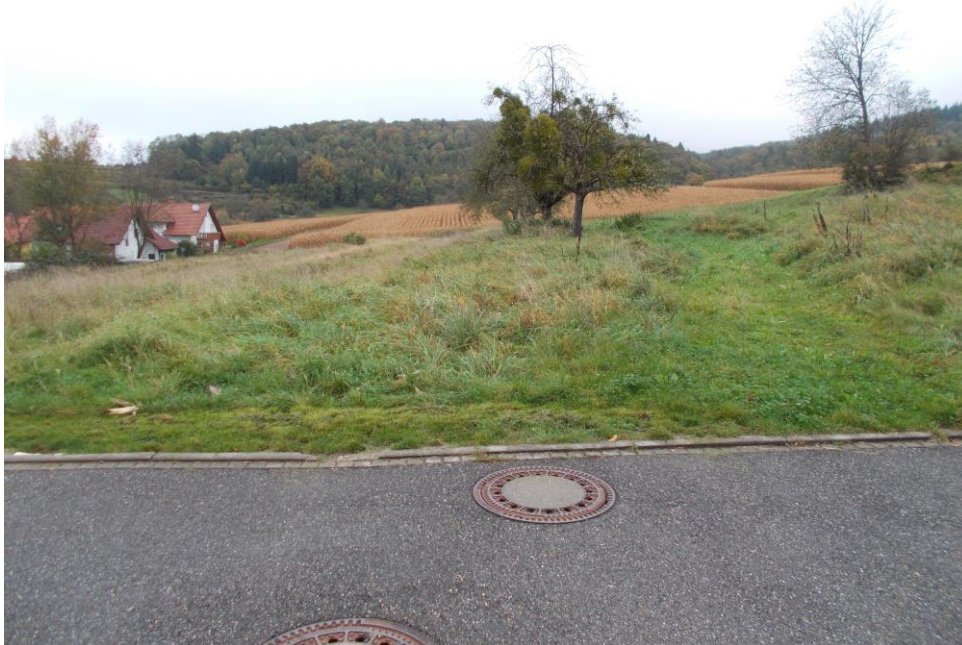
Bild 2: Blick auf das Erschließungsgebiet aus der Straße „Im Hinterfeld“